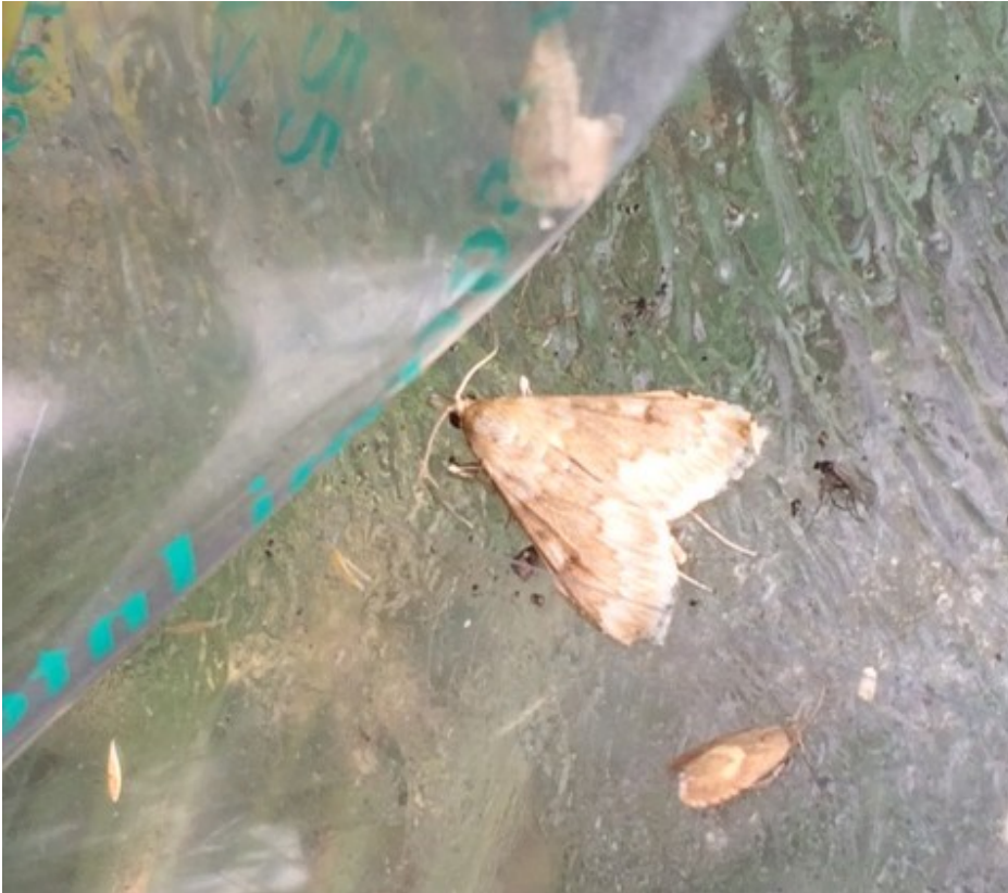
Billede 1. Majshalvmøl i feromonfælde fotograferet 20. juni af Hans Kristian Skovrup, Sønderjysk Landboforening.